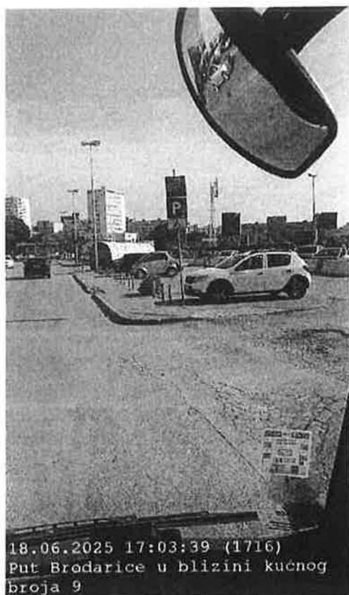
18.06.2025 17:03:39 (1716) Put Brodarice u blizini kućnog broja 9