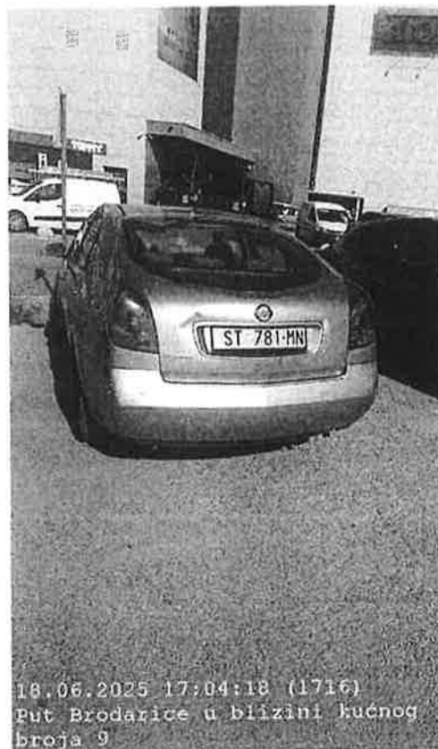
18.06.2025 17:04:18 (1716) Put Brodarice u blizini kućnog broja 9